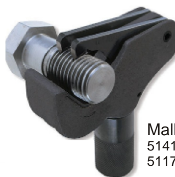
Mallit: 51418 (4-18mm) 511738 (17-38mm)