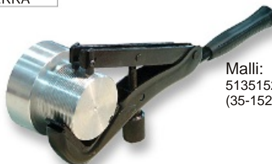
Malli: 5135152 (35-152mm)