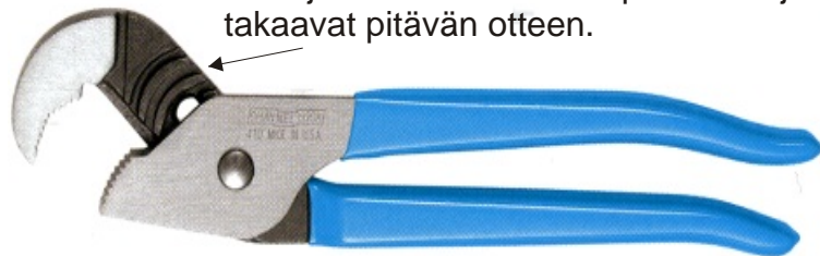
Mallit 410 414

Alaspäin viistetyt kielekkeet estävät leukojen sivuttaisliikkeenlipsumisen ja takaavat pitävän otteen.